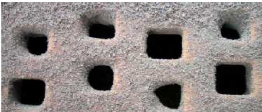
zugesezte Siebbeläge Partially clogged screen Grilles colmatées